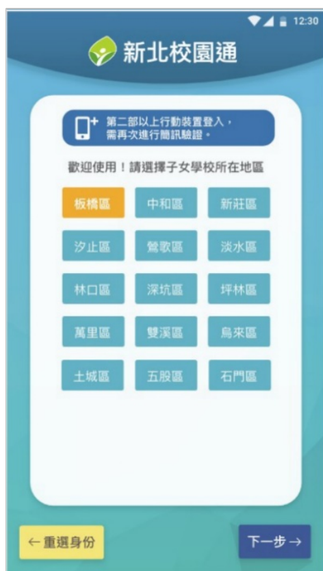
1. 選擇子女學校地區