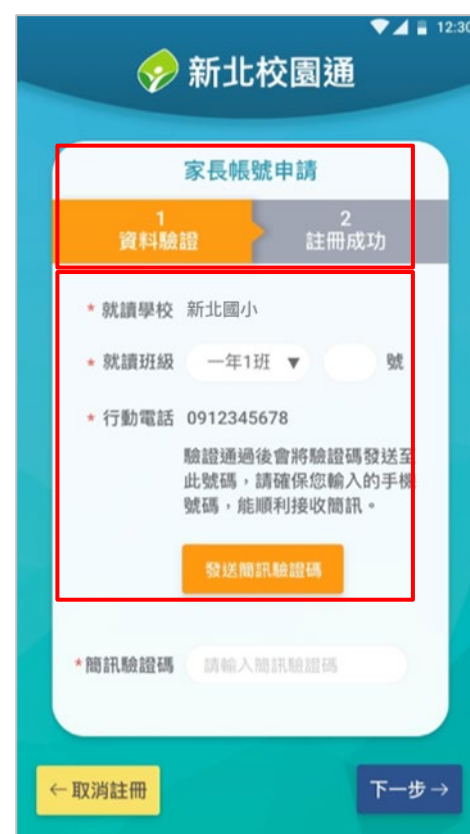
3. 雙重資料驗證 (子女資料比對、手機號碼簡訊驗證)